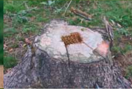
Baumstumpf mit der Motorsäge einschneiden