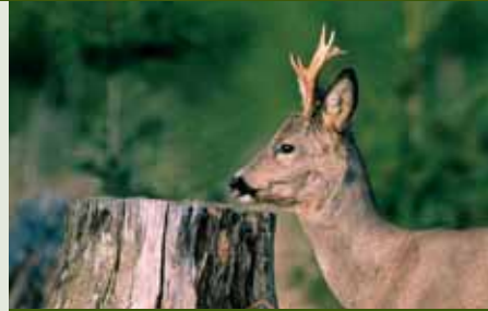
vorher / nachher

Die Salzpaste ist im täglichen Revier-einsatz flexibel anzuwenden. An fast jedem Ort wird durch die beigefügten Lockstoffe ein schnelles Auffinden der Salzleckstelle sichergestellt. Bringen Sie die Salzpaste möglichst bei trockener Witterung aus, um ein schnelles Aushärten zu ermöglichen. Gut bewährt hat sich die Ausbringung auf alten Baumstümpfen. Die Salzpaste zieht tief in das Holz ein und versorgt das Wild über lange Zeit mit den benötigten Mineralien.