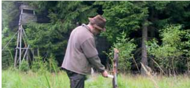
Salzstock dünn anstreichen

Tipp: Am besten eignet sich ein alter, schon leicht verwitterter Baumstumpf!